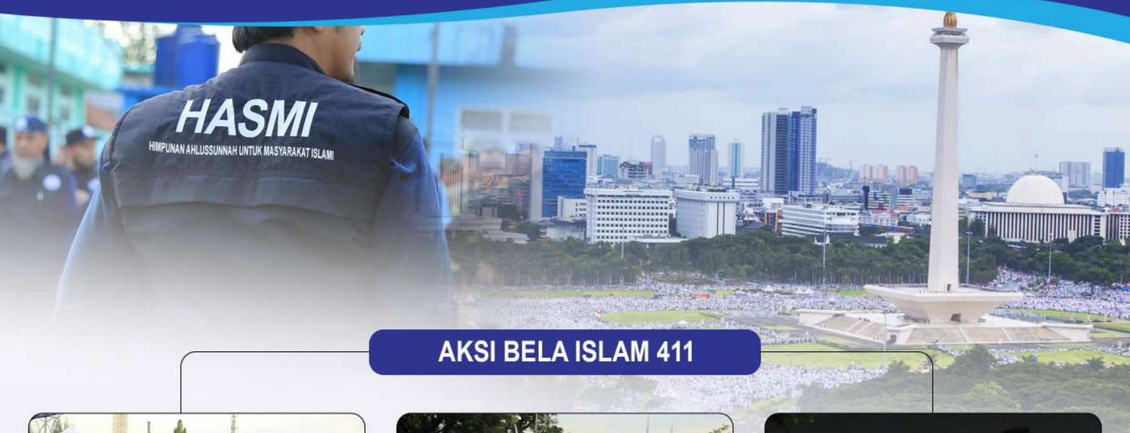
AKSI BELA ISLAM 411