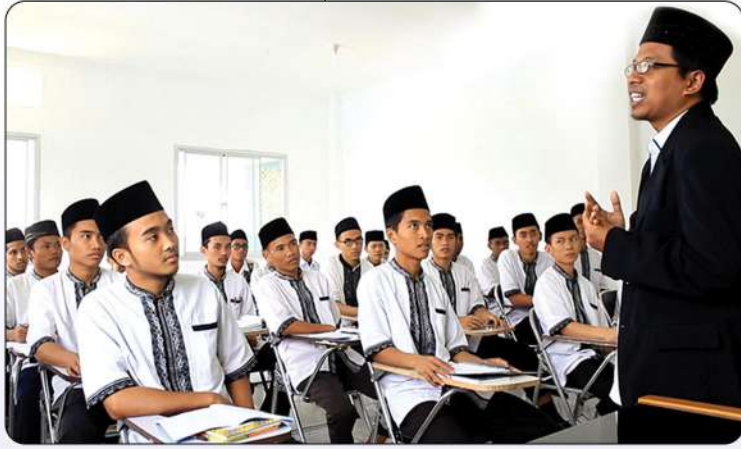
MA'HAD HUDA ISLAMI BOGOR