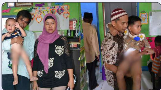
KHITAN MASAL GRATIS