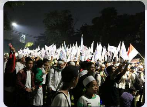
AKSI BELA ISLAM 212