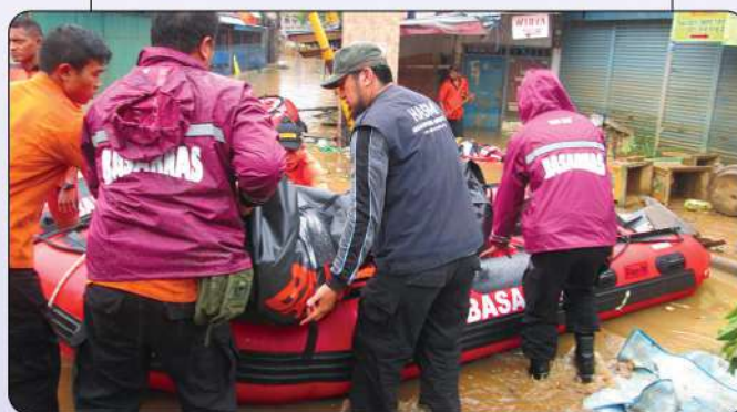
BANTUAN MUSIBAH BANJIR JAKARTA