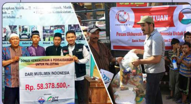
BANTUAN KEMANUSIAAN PALESTINA