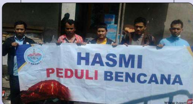
BANTUAN MUSIBAH GUNUNG BROMO MALANG